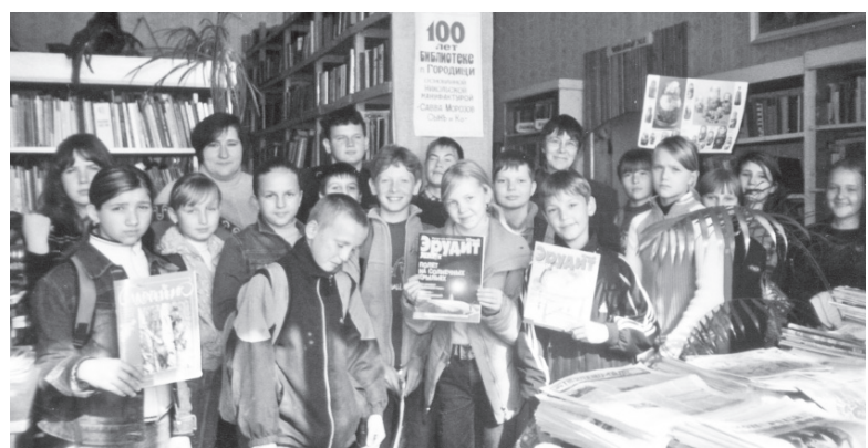
Школьники п. Городищи на празднике 100-летия библиотеки.