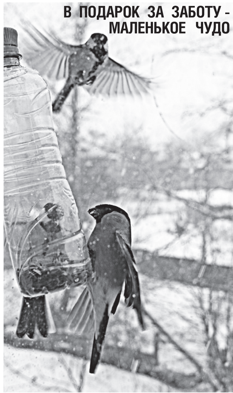
Как мы кормили птиц - читайте на 4 стр.