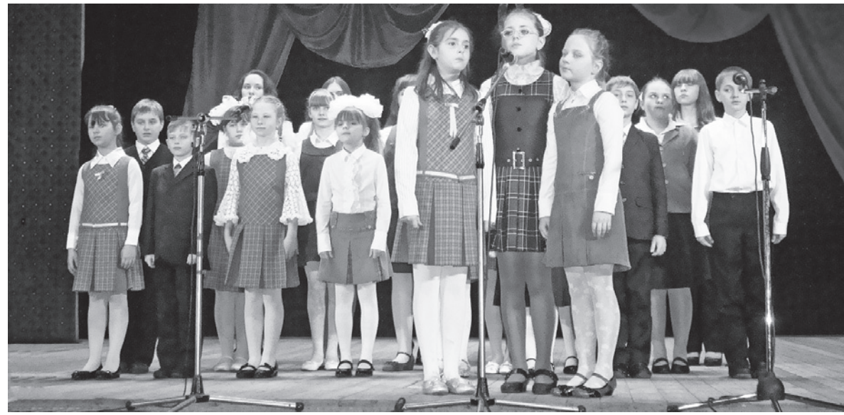
Здесь главный приз - минута славы