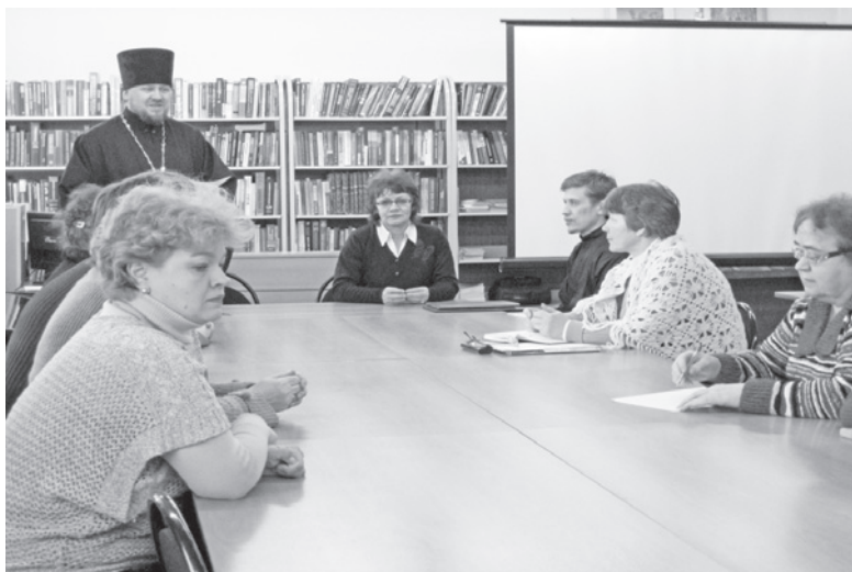
В кругу общих задач