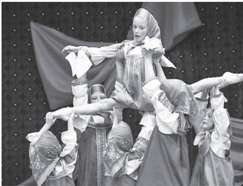
На высоте не только взрослые

В течение последних лет День работников культуры района гостеприимно встречает районный Дом культуры. Именно в его зрительном зале в среду на прошлой неделе и открылось итоговое совещание, посвященное подведению итогов работы учреждений культуры района в 2011 году. Вела совещание и выступала с основным