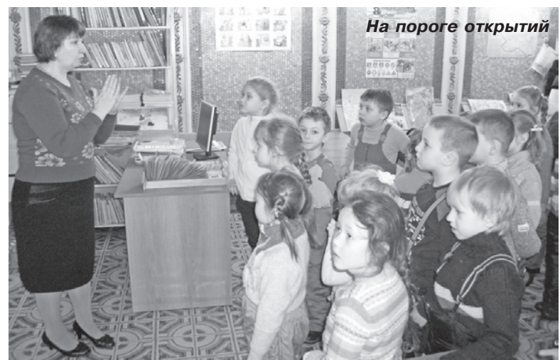
На пороге открытий