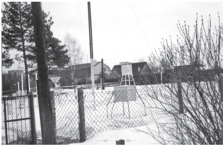
Территория МС «Петушки» оборудована приборами для метеорологических измерений.

В связи с профессиональным праздником поздравляю всех сотрудников МС «Петушки» и ветеранов службы. Желаю всем крепкого здоровья, счастья, достатка, удачи во всем. А также чистого воздуха, мирного и светлого неба, спокойной, без штормов, погоды!