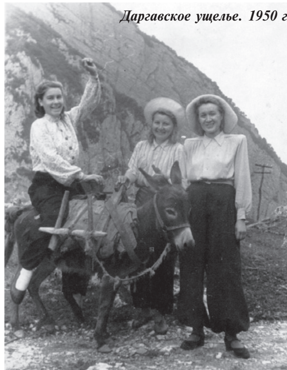
Даргавское ущелье. 1950 г.